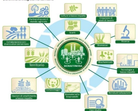
Bioraffineria integrata nel territorio

L'obiettivo era di realizzare a Porto Torres la più grande