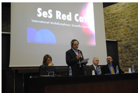
Un momento della cerimonia di apertura