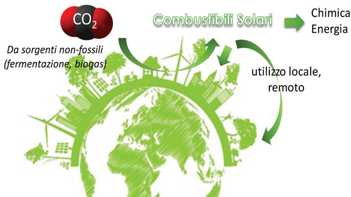
Fig. 1 - Illustrazione schematica del ruolo della conversione di \text{CO}_2 a combustibili liquidi, quale il metanolo per lo stoccaggio di energia rinnovabile in forma di energia chimica e per permettere sia l'utilizzo differito a livello locale che il trasporto e il commercio di energia rinnovabile a livello mondiale

da combustibili fossili) con quelli derivanti dall'accumulo dell'energia rinnovabile in energia chimica ("chemical energy storage") [9]. Attraverso reazioni, quale la conversione di \text{CO}_2 (ed \text{H}_2\text{O} ) a metanolo (ovvero combustibili liquidi solari) realizzata con energia rinnovabile [10], si crea un meccanismo che permette lo stoccaggio locale e la distribuzione di energia rinnovabile a livello mondiale (Fig. 1), andando ad integrarsi e, progressivamente, a sostituire l'attuale utilizzo di combustibili fossili, con costi anche inferiori alle possibili alternative di graduale sostituzione di combustibili fossili [11].