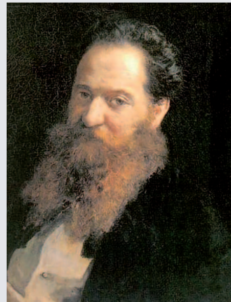
Fig. 2 - Moritz Schiff ritratto da Nikolaj Nikolaevic Ge (1831-1894)