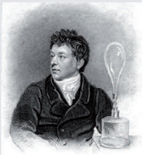
Frederick Christian Accum