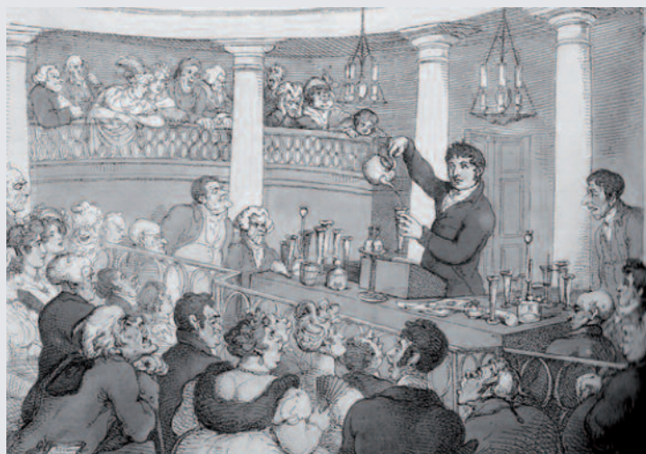
Fig. 1 - Accum durante una delle sue dimostrazioni chimiche

Nel 1817 Accum ha pubblicato Chemical Amusement, a Series of Curious and Instructive Experiments in Chemistry Which Are Easily Performed and Unattended by Danger , un piccolo volume di esperimenti che ha avuto un notevole successo presso gli appassionati. La prima edizione è andata esaurita in due mesi e la seconda addirittura in una settimana. Anche questo testo è stato tradotto in tedesco, in francese e in italiano (due volumi con il titolo Divertimento chimico contenente esperienze curiose , Milano, 1820, 2ª Ed., con il titolo La chimica dilettevole o serie di sperienze curiose e istruttive di chimica che si eseguiscono con facilità e sicurezza , Milano, 1854). Secondo Accum gli esperimenti (oltre un centinaio) potevano essere condotti "facilmente e senza pericolo" in casa. Molti lettori di oggi potrebbero storcere il naso di fronte a tali affermazioni; alcuni esperimenti, alla luce delle nostre attuali conoscenze,