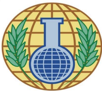
Organizzazione per la proibizione delle armi chimiche (OPCW)