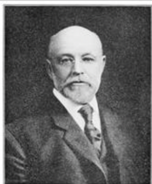
Ira Remsen 1846-1927

Quanto sia bello “sperimentare”, ma anche quanto sia importante dal punto di vista didattico, è ben sottolineato in un articolo della letteratura chimica americana 1 di cui è protagonista il giovane Ira Remsen, diventato poi un autorevole chimico ben noto per la sintesi della saccarina, e di cui una libera traduzione è qui di seguito riportata.